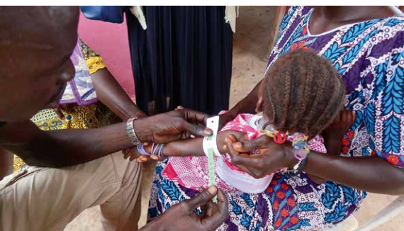
コミュニティ栄養センターでは、子どもの腕の太さを専用のメジャーで測り、栄養状態を確認