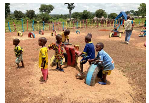
住民手作りの知育玩具には色が塗られ、「青！白！」などのかけ声にあわせ、遊びながら言葉を学習

こうした支援は、ユニセフや政府、地元NGOなどが協力して進めています。地域の状況を把握し、必要に応じて支援することで、地域の人々の自立につながるからです。また現地の「女性農業協同組合」と連携し、地元で必要な食糧の生産と女性の自立支援を進めています。