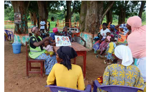
字が読めない母親も多いため、紙芝居で子どもの栄養改善に大切なことなどを説明します

こうした子どもたちを支援するため、ハッピーミルクプロジェクトではユニセフを通じて同国北部での栄養支援プログラムを実施。「FRANC」と呼ばれるコミュニティ栄養センターを各地に設立し、定期的に子どもたちや妊産婦の栄養状態をチェックしたり、栄養不足の子どもたちの早期発見・予防につなげています。また母乳育児の大切さを伝え、子どもの年齢に応じた食習慣をつけるため、母親への教育も行っています。